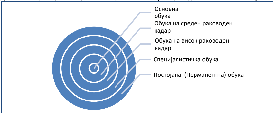
Графички приказ бр.2: Видови полициска обука

кои мерливи компоненти би се чувале во досието на секој полициски службеник, покажувајќи го степенот на напредок во кариерата. Овој тип на обука од една страна ги мотивира полициските службеници за подобрување на нивните перформанси, а од друга страна го потврдува исполнувањето на минималните стандарди за полициско работење, кои може врз основа на параметрите да се насочат кон покачување.