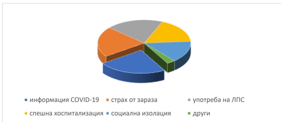
Фиг.2 Затруднения при осигуряване на качествени здравни грижи по време на COVID-19 пандемията

Паралелно с мнението на управителите на домове за стари хора беше проведено и проучване с 62 медицинските сестри, полагащи здравни грижи за възрастните и стари хора. Като основни затруднения при осигуряване на здравни грижи за домуващите посочват: липсата на достатъчно информация относно протичането и лечението на COVID-19 – 57 медицински сестри (91,8%); страх от заразяване са изпитвали 51 (82,1 %) от тях; недостатъчно знания относно правилната употреба на личните предпазни средства пък изтъкват 48 (77,3%) от анкетираните; нуждата от спешна хоспитализация на домуващите е била притеснителна за 41 (66%) от сестрите; социална изолация за 36 (57,9%) от тях и едва 7 (11,3%) лица посочват други. (Фиг.2)