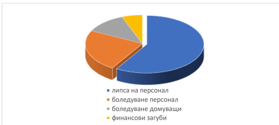
Фиг.1 Основни проблеми в домове за стари хора по време на COVID-19 пандемията

За висок процент на заболяемост и смъртност сред домуващите съобщават двама (13%) от управителите на домове за стари хора, както и произтичащите финансови загуби за собствениците на частни домове за стари хора според 1 (7%) от управителите. Общия процент на отговорите е над 100%, защото според управителите не може да се посочи един единствен проблем, а става въпрос за редица фактори (Фиг. 1)