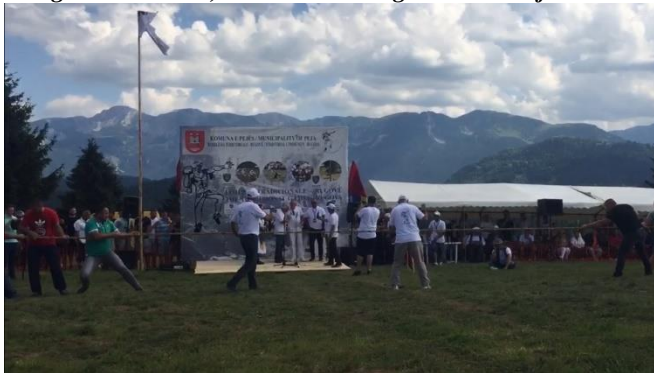
Slika: Rugovska klisura, Tradicionalne igre-takmicenje -Etno turizam

Međutim, moramo istaći i da kvalitetan deo turističke ponude u našoj zemlji se mora prilagoditi zahtevima savremenog turističkog tržišta. Stabilizacija društveno-ekonomskog i sigurnosnog okruženja zemlje i regije jedan je od glavnih faktora koji će uticati na razvoj turizma u našoj zemlji u narednom razdoblju. Ruralni turizam koji je komponovan od nekoliko oblika turizma koje ćemo predstaviti u nastavku, odgovara i opštoj ponudi našeg podneblja: