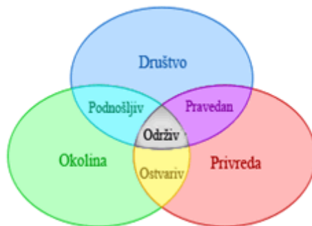
Sema 1. Odrzivi razvoj kao presjek tri sastavna elementa

Pojam odrzivog razvoja cesto se poistovjecuje sa pojmom zastite zivotne sredine, to nas dovodi do pogresnih zakljucaka. Zastita zivotne sredine samo je jedan od 3 elementa odrzivog razvoja. Tri elementa odrzivog razvoja su drustveni, ekonomski i ekoloski. Danas se cesto u savremenoj literaturi koristi skracenica PPP (People, Profit, Planet) da bi se jasnije pojasnio koncept odrzivog razvoja.