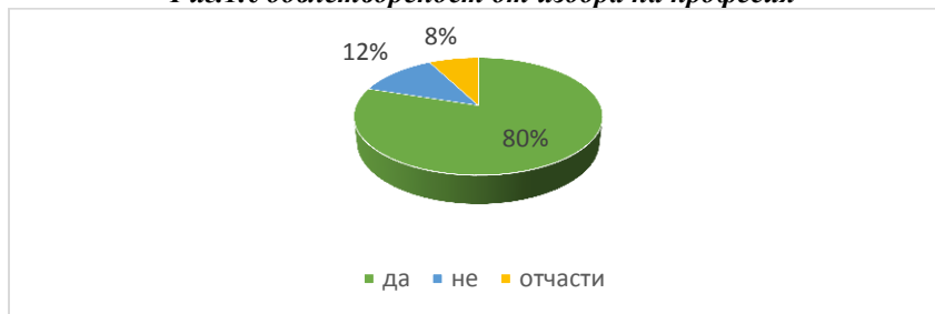
Фиг.1. Удовлетвореност от избора на професия

Силната мотивация при упражняване на професията е породена от направения съзнателен избор за обучение в избраното професионално направление „Акушерка“ за 73,8%. Над половината от анкетираните определят като високо натоварването на работното място (фиг.2).