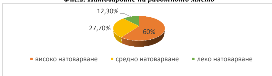
Фиг.2. Натоварване на работното място

Основен рисков фактор при упражняване на акушерската професия сред анкетираните е стреса (78,5%), а причините за стрес на работното място са разнообразни, зависими от компонентите на средата и субектите. Това са всички трудови ситуации и проблемите, които ги съпътстват, за които са характерни високите професионални изисквания в количествен план (твърде много работа 67,7%), работещите имат ограничена възможност за вземане на решение (възможност да се реши как и какво да се върши 43,1%) и недостатъчна професионална подкрепа от колеги и ръководители за 44,6%.