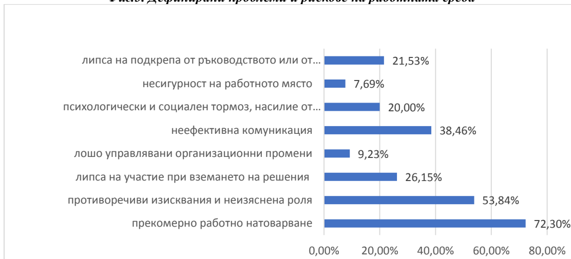
Фиг.3. Дефинирани проблеми и рискове на работната среда

Забележка: Сумарно резултатите са над 100%, защото анкетираните са дали повече от един отговор.