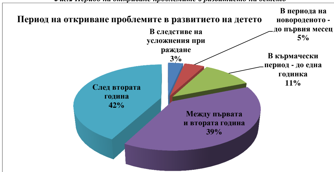
Фиг.2 Период на откриване проблемите в развитието на детето

Ранното откриване на първите признаци на увреждане на детето дават по-големи възможности за навременна реакция и лечение. Чрез ранното откриване и започване на адекватно лечение се намаляват значително възможностите за усложнения и тежки инвалидизации на децата. Според резултатите от анкетното проучване се установява, че родителите в повечето случаи не са информирани от медицинските специалистите за съществуващ проблем в развитието на детето си. Едва 37,0 % от тях твърдят, че са получили тази информация от лекар специалист. Много от родителите разчитат на собствени познания и наблюдения, както и на хора със сходни проблеми. Все по-модерно става информацията за здравословното състояние да се набавя чрез интернет източници. Навлизането на информационните технологии в живота е необходимо и нормално, но когато се касае за здравна информация тези източници трябва да бъдат добре прецежени, подходящи за немедицински лица, с достъпна и достатъчна информация, която по никакъв начин да не отменя консултациите и съветите от медицински специалист, а да ги допълва и доразвива. (фиг. 3).