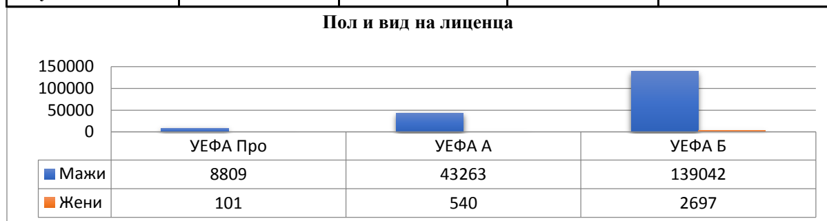
Графикон број 3 - Застапеност на фудбалски тренери според пол и вид на лиценца во 54-те национални фудбалски асоцијации во периодот од 2015-2016 година

Од табела број 3 и графикон број 3 може да се забележи дека од вкупно 194.452 лиценцирани УЕФА Про, УЕФА А и УЕФА Б тренери, мажи се вкупно 191.114, а жени 3.338. Од вкупно 8.910 лиценцирани УЕФА Про тренери, мажите се застапени со 8.809, а жените со 101. Од вкупно 43.803 лиценцирани УЕФА А тренери, мажи се вкупно 43.263, а жени 540. Од вкупно 194.452 лиценцирани УЕФА Б тренери, мажи се вкупно 139.042, а жени 2.697.