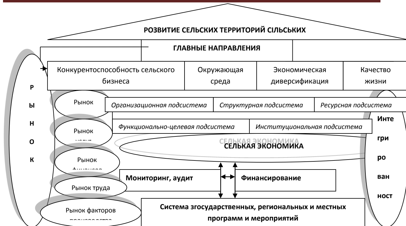
Рис. 2. Позиционирование сельской экономики в развитии сельских территорий