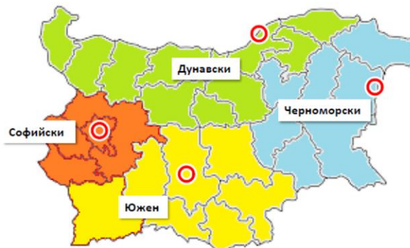
Фиг. 6. Райони за планиране при Вариант 5

Пети вариант - предложение на арх. Белин Моллов. Този вариант е доразвиване на вариант 2 на междуведомствената работна група. Водещ мотив е четирите района за планиране да са съобразени с естествените географски характеристики на територията, историческо и селищно развитие. Област Търговище се остава в Черноморския регион, област Благоевград се присъединява към Южния район (Тракийско – Родопски – Пирински), оформя се Столичен регион, обединяващ Софийската агломерация с областите Перник и Кюстендил (Моллов, 2018).