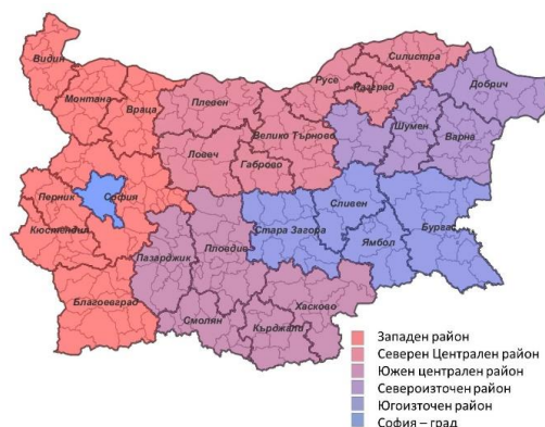
Фиг. 4. Райони за планиране при Вариант 3