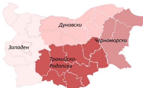
Фиг. 5. Райони за планиране при Вариант 4

Четвърти вариант - предложение на ИПИ. Институтът за пазарна икономика, който системно изследва регионалното развитие чрез своите анализи, публикувани в електронния сайт „Регионални профили“ ( http://www.regionalprofiles.bg/ ), също има свое предложение за ново регионално деление на страната. То се състои в обособяването на четири района, представени на Фиг. 5. Оформят се Дунавски, Черноморски, Тракийско-Родопски и Западен райони за планиране, като два от тях – Черноморският и Западният, нарушават границите на NUTS 1 (Николова, 2018).