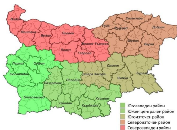
Фиг. 2. Райони за планиране при Вариант 1

Първият вариант за ново райониране на България предвижда в страната да има 5 района от ниво NUTS 2: Югозападен, включващ областите София-град, Софийска, Благоевград, Кюстендил и Перник; Южен Централен, включващ областите Пазарджик, Пловдив, Хасково, Кърджали и Смолян; Югоизточен, включващ областите Стара Загора, Сливен, Бургас и Ямбол; Североизточен, включващ областите Търговище, Русе, Разград, Силистра, Добрич, Варна и Шумен; Северозападен, включващ областите Видин, Монтана, Враца, Плевен, Велико Търново, Габрово, Ловеч, Габрово и Велико Търново (Фиг. 2).