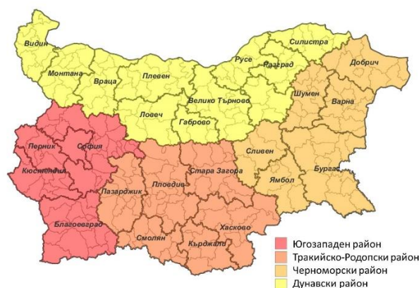
Фиг. 3. Райони за планиране при Вариант 2

Вторият вариант предвижда в страната да има 4 района от ниво 2: Югозападен, включващ областите Софийска, София-град, Благоевград, Кюстендил и Перник. Тракийско-Родопски район, обхващащ областите Пазарджик, Пловдив, Стара Загора, Хасково, Кърджали и Смолян. Черноморски район, в който влизат областите Сливен, Ямбол, Бургас, Варна, Добрич и Шумен. Дунавски район, включващ областите Търговище, Видин, Монтана, Враца, Плевен, Ловеч, Габрово, Велико Търново, Русе, Разград и Силистра. В Аналитичния доклад от 2013 г. този вариант съществуваше в две модификации като Черноморският район беше без областите Сливенска и Ямболска и с Търговищка област. В крайна сметка бе одобрен вариант на четири районно деление във вида, показан на Фиг.3.