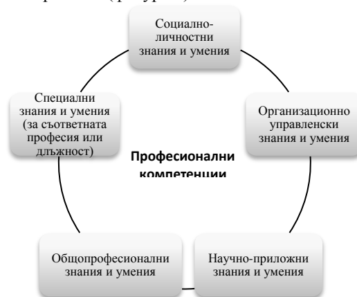
Фигура 2 Видове знания и умения, изграждащи професионалните компетенции.

Съобразено с целите на обучението и предявените изисквания към него от страна на потребителите на кадри, знанията и уменията, изграждащи професионалните компетенции, могат да бъдат разгледани като сума от пет основни групи (типове) знания и умения, разделени съобразно функциите и характеристиките на качествата, които се създават чрез тях. (фигура 2)