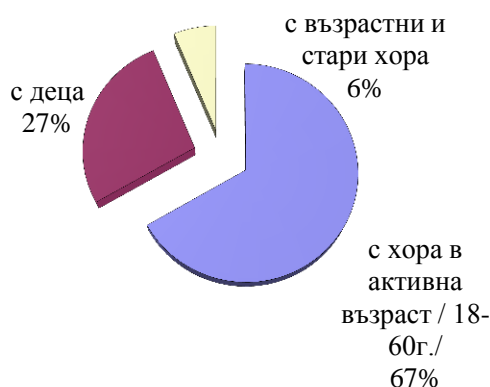
Фиг. 1. Желание на студентите за работа с възрастни и стари хора

Анкетното проучване позволи да се установят причините, поради които по-голямата част от студентите нямат желание да се грижат за възрастни и стари хора. Получените резултати се ранжират по следния начин: