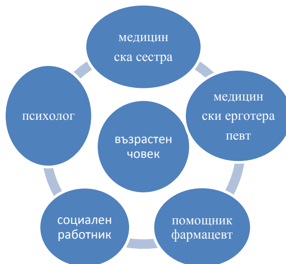
Фиг. 3. Модел на екип от доброволци за гериатрични грижи

Участието на студенти в промотивни и профилактични дейности се организира и подготвя не само в Домове за стари хора, но и в Клубове за възрастни и стари хора в социалната общност. Сформират се интердисциплинарни екипи от доброволци, в които се включват студенти от здравно и социално направление. Те активно участват в реализирането на гериатрични грижи под ръководството на преподаватели (виж фиг. 3):