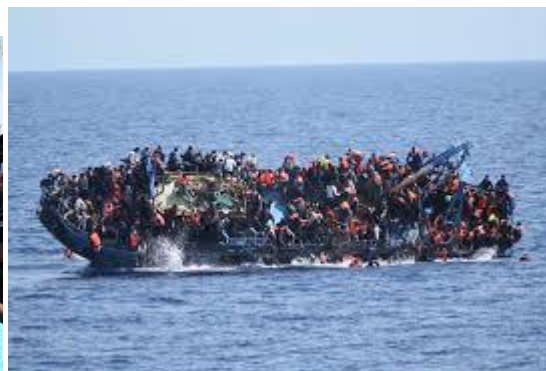
Слика 2. Мигранти од Либија и Мароко Слика 3. Ризичниот пат на мигрантите

Според податоците на Шпанските власти може да се каже дека мигрантите од Западна Африка, кои минатите години одеа во Либија, а сега ја бираат Шпанија како нова рута. Од тие причини Шпанија за справување со мигрантите кои доаѓаат преку западната медитеранска рута, особено со зголемување на нивниот број до средината на 2018 година побара материјална помош од Европската унија в износ од 35 милиони евра.