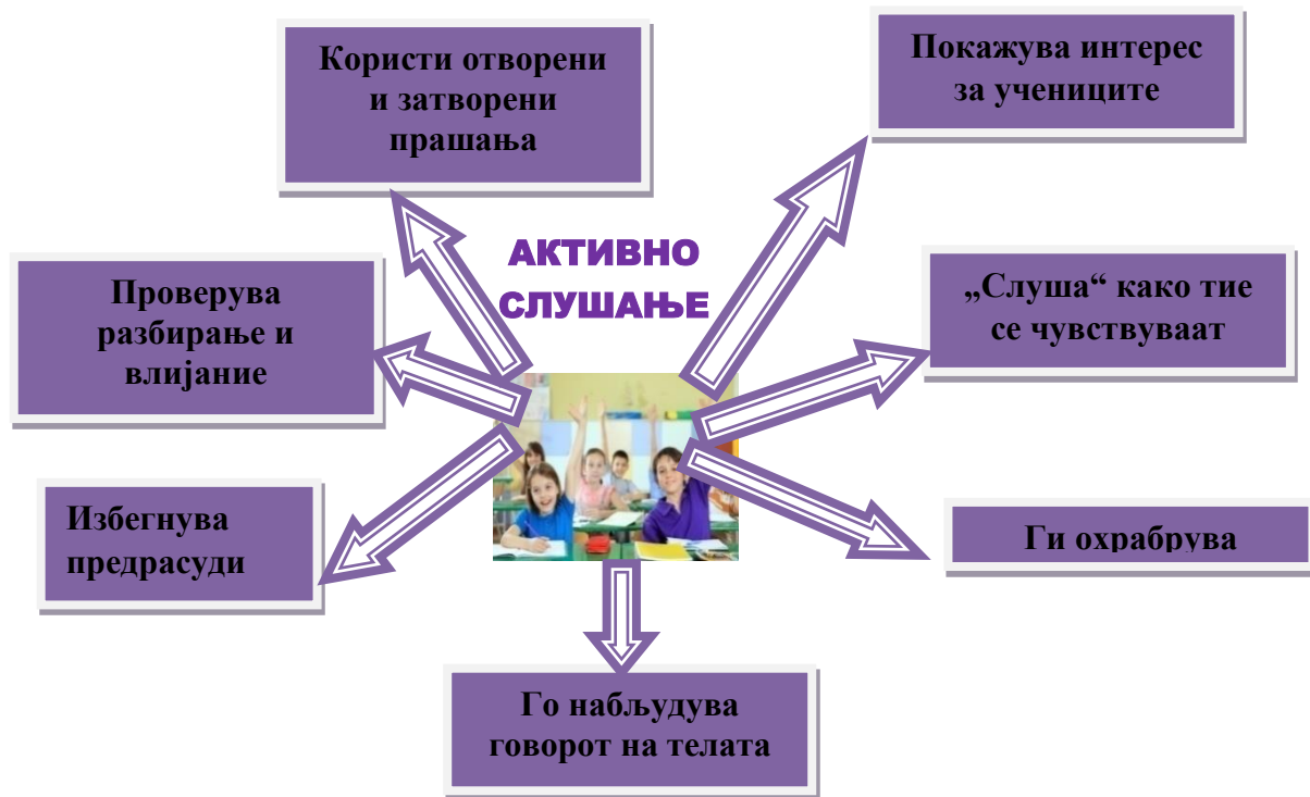
Графички приказ бр. 2: Елементи на кои наставникот треба да внимава доколку сака да постигне активно слушање од страна на учениците

Исто така е добро да им се овозможи на учениците-слушатели да парафразираат одредени делови од слушаното, за да се добие повратна информација колку го разбрале она што го слушале. Воедно, треба да се истакне важноста на невербалниот говор, како еден од поважните фактори за активното слушање. Обезбедувањето активно слушање од учениците – како реципиенти во комуникативниот процес, кога наставникот е поставен во улога на комуникатор, можеме да го прикажеме и графички (Графички приказ бр.2), со кој се означени основните принципи на кои наставникот (како комуникатор) треба да внимава, доколку сака да постигне активно слушање од страна на учениците.