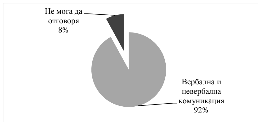
Фиг.1 Познаване на основните видове комуникация според студентите медицински сестри

При направеното проучване студентите трябваше да посочат основните видове комуникация. Анализът показва, че 92% от респондентите са запознати, както вербалната, така и невербалната комуникация. Не е малък процента (8%) на студентите, които са колебливи в твърденията си или посочват, че не могат да отговорят (Фиг. № 1).