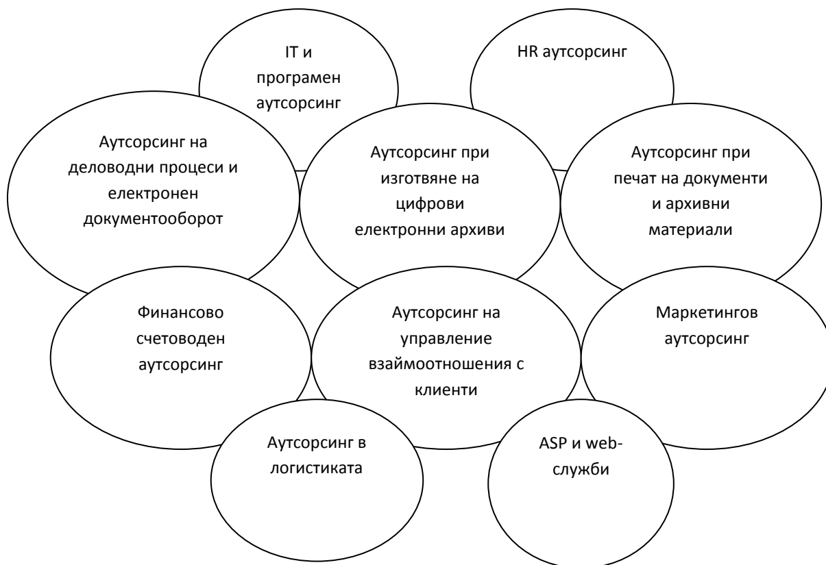
Фигура 2: Сфери на приложение на аутсорсинга

Тези форми зависят до голяма степен от различните сфери на приложение на аутсорсинг услугите в организацията, посочени на Фигура 2. [3]