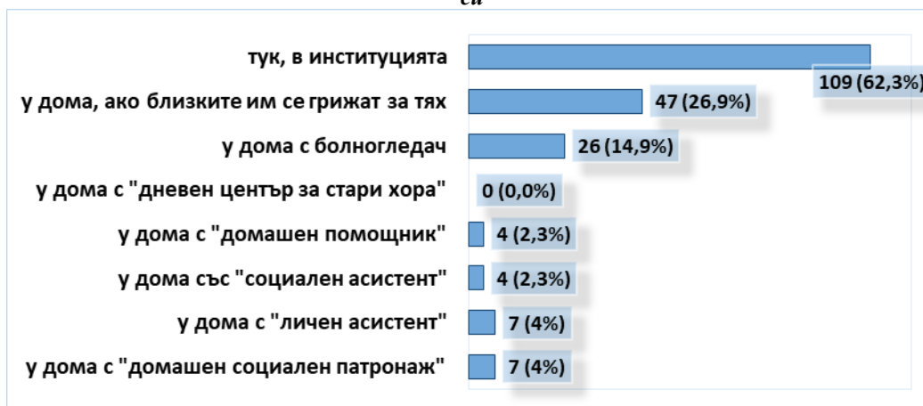
Фигура 4. Разпределение на респондентите спрямо това къде биха се чувствали по-сигурни за здравето си

Проучено е и мнението на респондентите за условията на живот. Те трябваше да посочат къде според тях условията са по-добри - в дома, от който идват или в институцията. Над половината (63%) от интервюираните споделят, че в институцията са срещнали по-благоприятни условия на живот в сравнение с тези в дома им. Получените резултати се обясняват с факта, че голяма част от тях нямат сигурен дом и близки, които да се грижат за тях. В един от домовете, участвали в проучването, много от настанените споделиха, че това място е единствената им алтернатива, тъй като са загубили дома си след развод, преписване на близък или имотна измама.