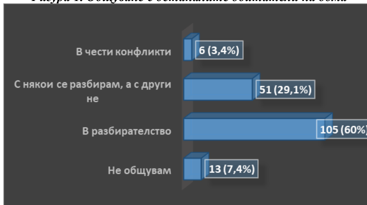
Фигура 1. Общуване с останалите обитатели на дома

Общуването на настанените с персонала в институцията е представено на Фигура 2. Най-голям дял от респондентите (59%) общуват в разбирателство със служителите от дома за стари хора. На второ място (27%) се нарежда дялът на респондентите, които определят персонала като отзивчив, а на трето се нареждат тези, които дават относителния отговор, че се разбират добре само с някои от служителите (7%). Макар и с пренебрежимо нисък дял (общо 3%), сред получените резултати се наблюдават и негативни отговори. Шест от респондентите (2%) определят отношението на персонала към тях като пренебрежително. Това са лица на възраст от 74 до 92г., четири от които са жени, а двама са мъже. Получени са и резултати, макар и с пренебрежим дял (1%) за оказана вербална агресия върху трима от участниците в изследването. Двама от тях са и сред лицата, определили поведението на персонала като пренебрежително.