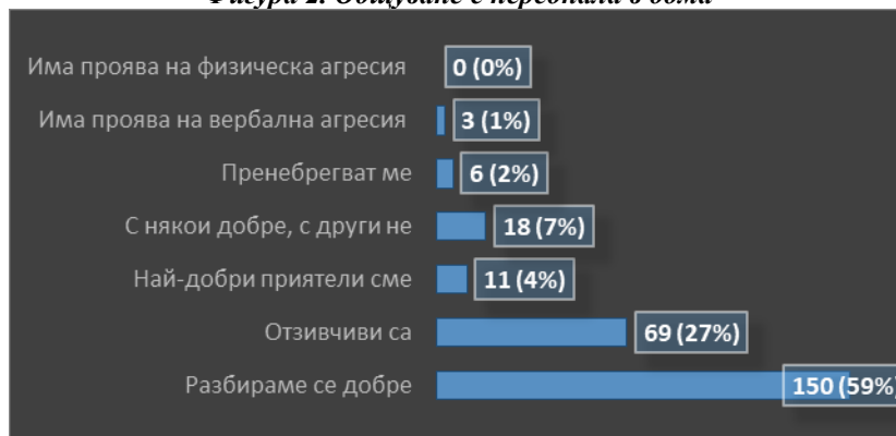
Фигура 2. Общуване с персонала в дома

По отношение на удовлетворението от храната, която получават в ДСХ, 69% от изследваните лица посочват, че потребностите им са напълно задоволени (Фигура 3). Вторият по разпространение отговор (28%) е, че храната не им харесва, защото не съвпада с вкуса им. Преобладава дялът на лицата, които са доволни от храненето в дома. Този резултат би могъл да се обясни с факта, че голяма част от лицата нямат алтернатива за друго място, където биха могли да живеят. От друга страна, много от ползвателите на тази услуга се чувстват улеснени, защото не им се налага да пазаруват и приготвят самостоятелно храната си. Това е от голямо значение, особено за лицата с тежки съпътстващи заболявания.