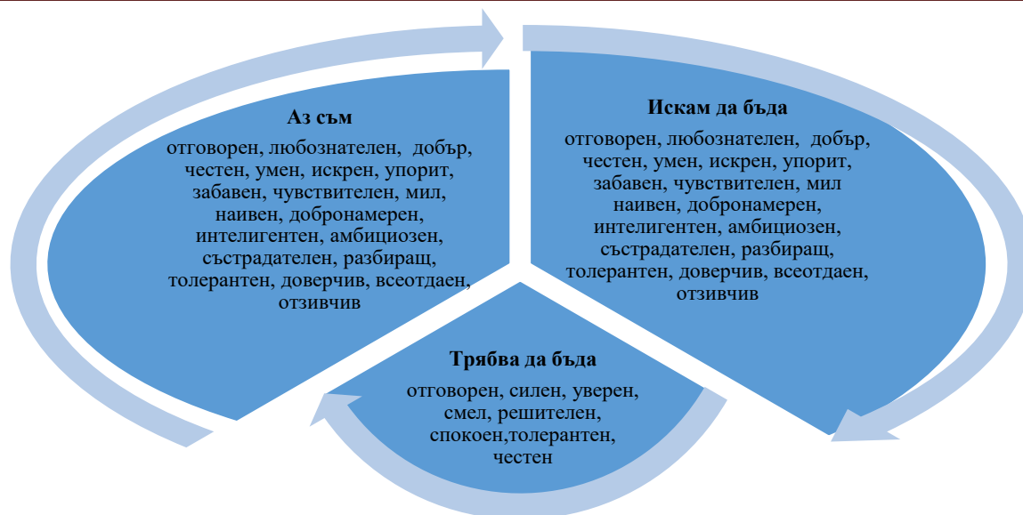
Фигура 1. Най-често използвани самоописания за трите Аз-концепции