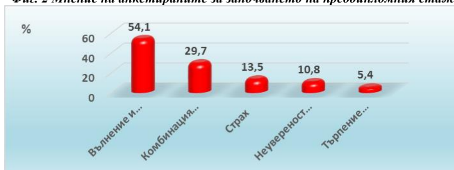
Фиг. 2 Мнение на анкетиранияте за започването на преддипломния стаж

На стажант-акушерките трябва да бъде давана възможност в определени ситуации да могат да показват свободно своите чувства и емоции. Резултатите от анкетата показват в различна степен емоционалните преживявания на студентите преди встъпването им в преддипломния стаж. (фиг.2) Право на всеки човек е да изразява себе си като и мнението му трябва да бъде уважено от другите. Откритото изразяване на емоциите и чувствата е проява на „асертивно поведение“, което гарантира спокойна професионална обстановка и липса на конфликти.