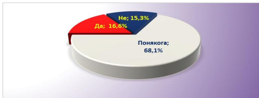
Фиг. 3 Мнение на анкетираните относно срещани затруднения по време на учебния процес

Потърсихме мнението на студентите за това дали срещат трудности при усвояването на учебния материал. Резултатите на фиг.3 показват най-висок относителен дял на студентите отговарящи „Понякога“ (68,1%), което надвишава почти 5 пъти другите две групи, отговорили с „Да“ (16,6%) и с „Не“ (15,3%). За съжаление процента на студентите, които твърдо заявяват, че не срещат затруднения е твърде нисък. Причините могат да бъдат различни, като не изключваме и психологическия момент особено за студенти от първи курс на обучение. Учебният материал може да затруднява студентите, но е уместно да се потърсят причините за трудностите и да се намери подходящ подход за преодоляването им.