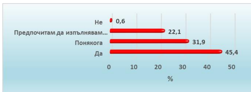
Фиг.1 Самостоятелност при изпълнение на поставени задачи по време на практически обучение

При анализ на въпроса „Смятате ли, че можете да се справите самостоятелно с поставени задачи от преподавател?“ с най-голям относителен дял се открояват анкетиранияте, отговорили, че са готови за изпълнение на поставените от преподавател задачи(45,4%). Те са уверени в себе си и заявяват категоричен отговор „Да“, изразявайки свободно своето мнение. Относително висок е дялът и на студентите, които споделят отчасти несигурност (31,9%), но предвид на това, че те са обучаващи се, е очакван отговор. Най-малък е дялът на отговорилите, че ще изпълняват поставените задачи под постоянен контрол на преподавател - 22,1%, но това би могло да се дължи на колебание и несигурност, а не на отказ и нежелание от страна на студентите.(фиг.1)