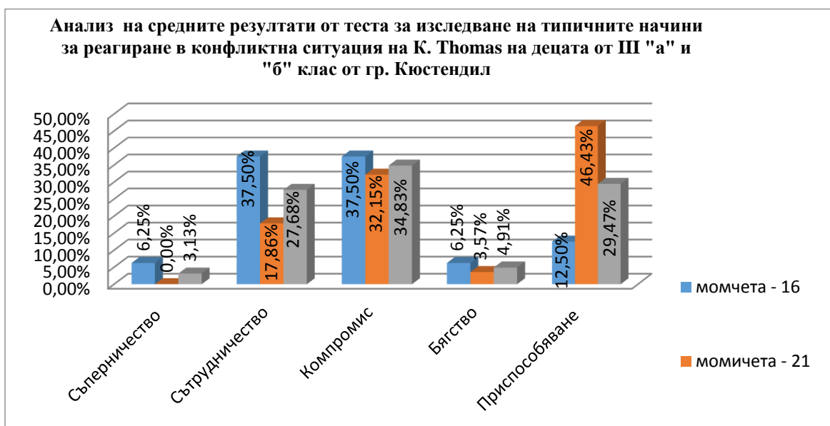
Графика №: 1