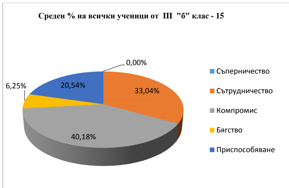
Диаграма №: 2

Най-характерната форма на социални интеракции между учениците от трети „б” клас се оказва компромисната.