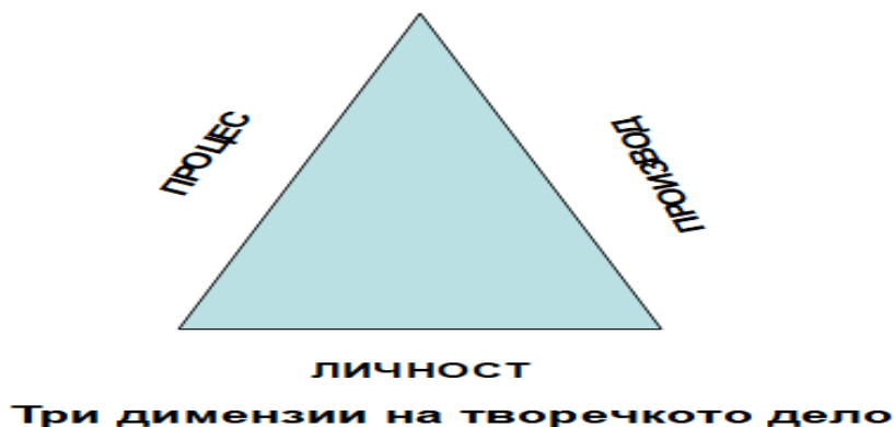
Слика бр 1.

Творечкиот процес е централно прашање на творештвото. Тој ги поврзува личноста и делото. Творечкиот процес се однесува на откривањето и развивањето на нови производи. Делото е финален ефект на личноста и процесот. Творечкото дело, личноста и процесот означуваат единствен и неразвоен систем на човековата егзистенција. Творечката личност е главен двигател за наставникот на некое дело.