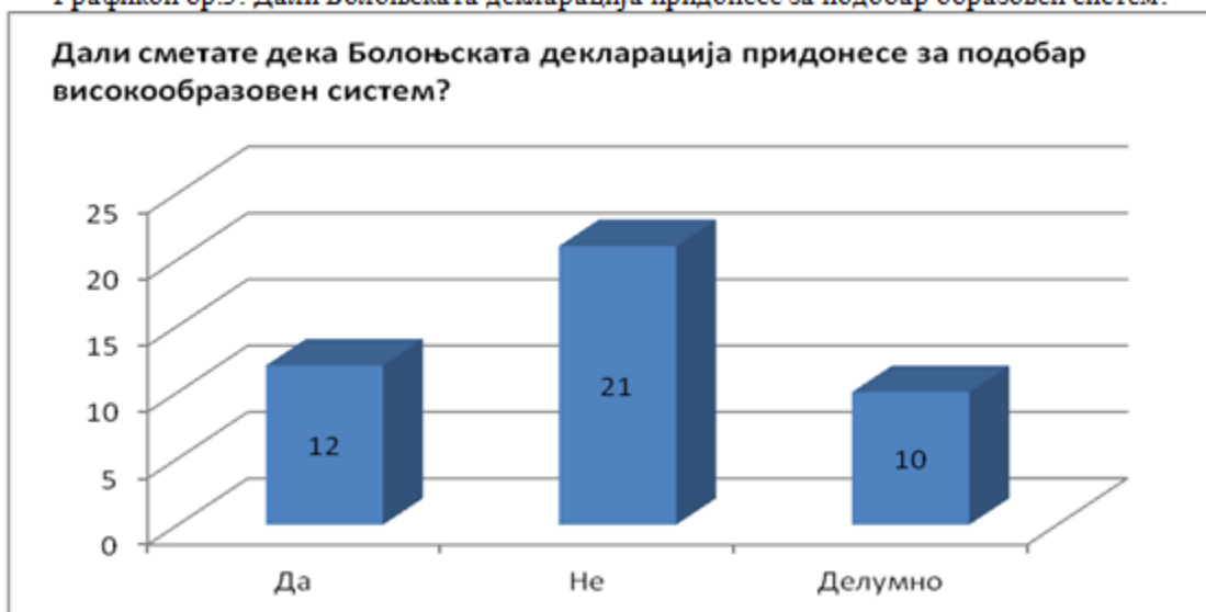
Графикон бр.3: Дали Болоњската декларација придонесе за подобар образовен систем?

Испитаниците на изјавата „Болоњскиот систем на студирање е подобар од претходниот начин на студирање“, покажаа дека мислат дека Болоњскиот систем не е подобар од претходниот начин на студирање (односно 50% изјавија дека воопшто или делумно не се согласуваат), 8% (само 6 испитаници) кажаа дека ниту се согласуваат, ниту не се согласуваат, додека пак 18 испитаници (37.5%) велат дека се согласуваат со изјавата. Ниту еден испитаник не одговори дека целосно се согласува со изјавата дека Болоњскиот систем е подобар од претходниот систем на образование.