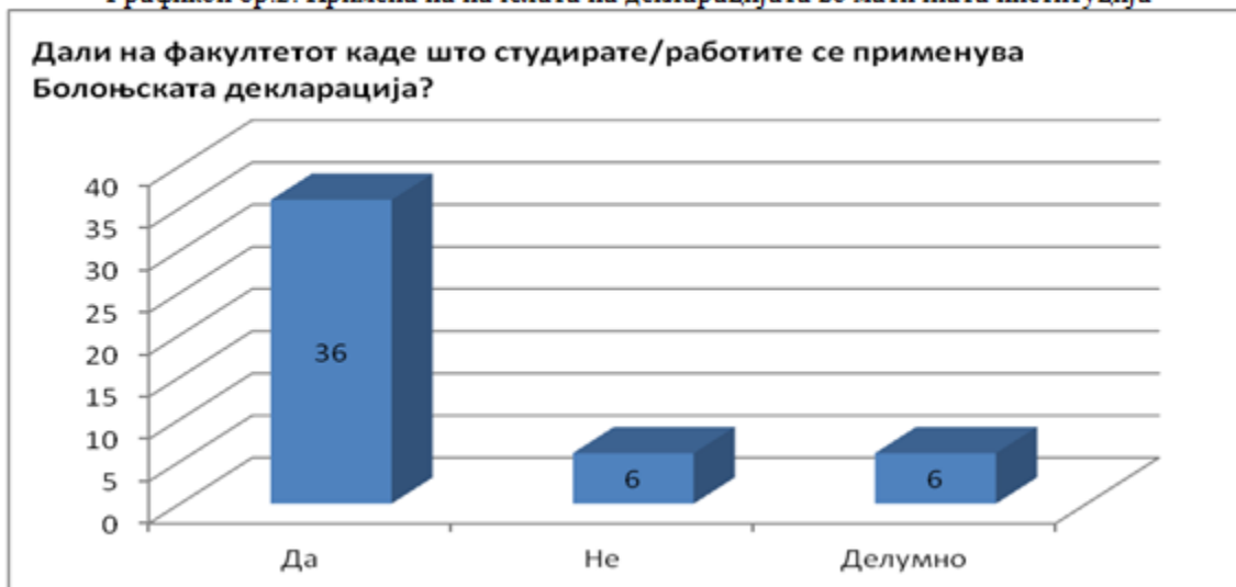
Графикон бр.2: Примена на начелата на декларацијата во матичната институција

Мислењето на испитаниците се разликува кај прашањето „Дали Болоњската декларација придонесе за подобар високообразовен систем?“. Скоро половина од нив (43.7%) дадоа негативен одговор, помал дел (25%) дадоа потврден одговор, а многу малку (4.8%) рекоа дека придобивките делумно се искористиле.