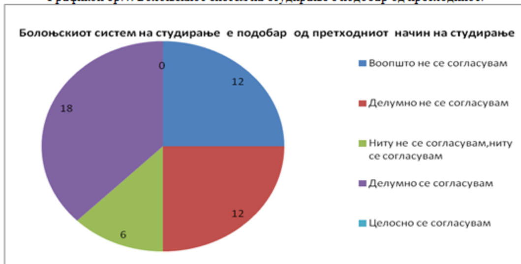
Графикон бр.4: Болоњскиот систем на студирање е подобар од претходниот.

Кај изјавата „Болоњската декларација ја олеснува размената и мобилноста на студентите и наставниот кадар“ поголемиот дел од испитаниците се согласија со оваа изјава - 62.5% од испитаниците целосно/делумно се согласуваат со изјавата. Како и да е, една третина од нив имаа негативно мислење.