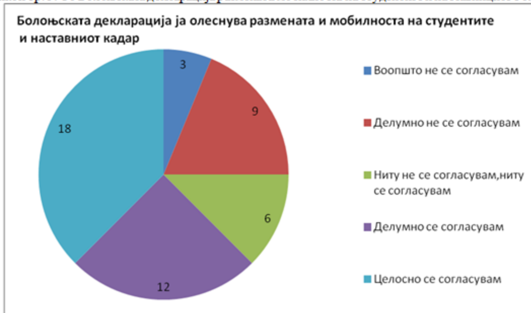
Графикон бр. 5: Со Болоњската декларација размената/мобилноста на студентите и наставниците е олеснета

Во однос на прашањето дали Болоњската декларација треба да претпри промени за да биде ефикасна и ефективна во модерното опкружување, 72.9% од испитаниците рекоа дека целосно/делумно се согласуваат. 8% немаат изразен став, односно ниту се согласуваат ниту не се согласуваат, а 1.8% не мислат дека декларацијата треба да претпри промени за да биде ефикасна.