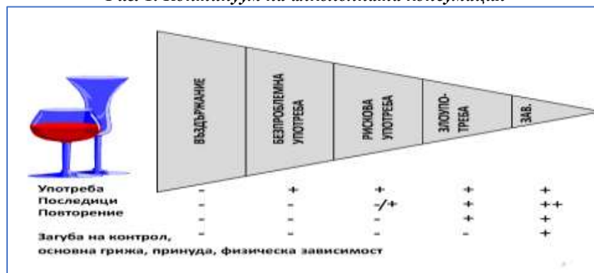
Фиг. 1. Континуум на алкохолната консумация