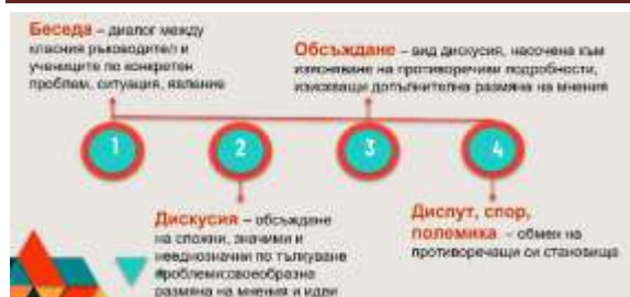
Фиг. 3 Педагогически умения а)