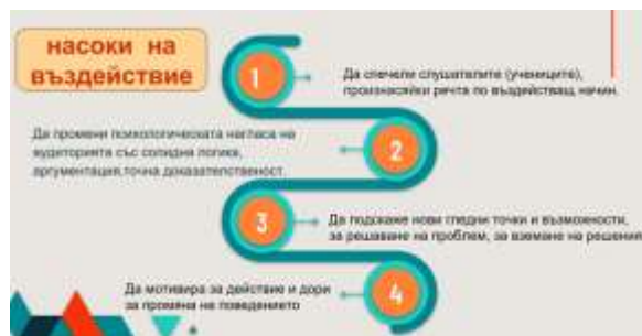
Фиг. 4 Как влияе учителят?