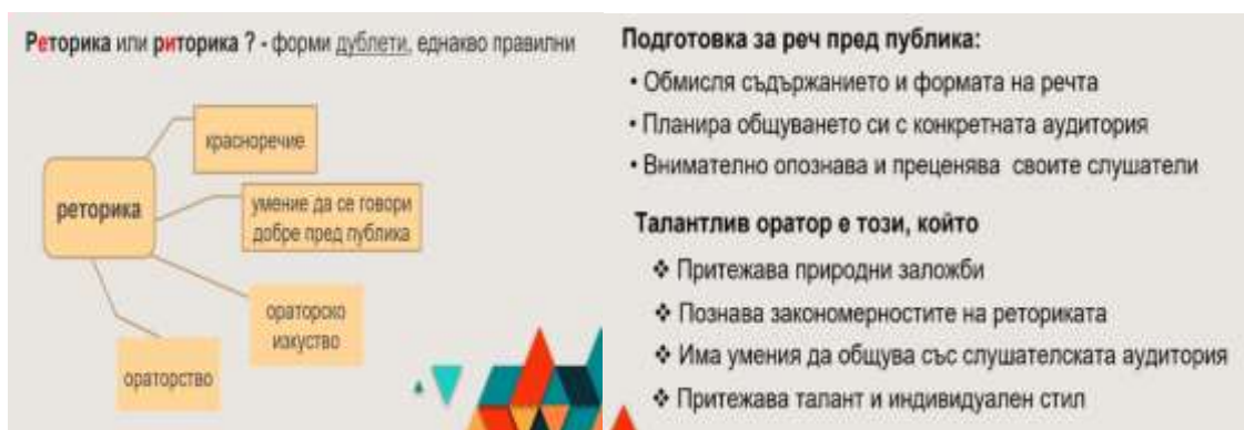
Фиг. 1 Умения на учителя