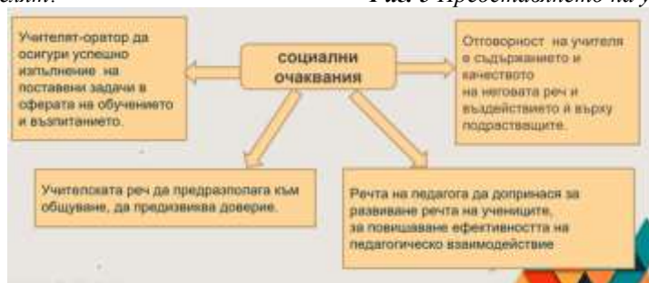
Фиг. 6 Учителят е ВДЪХНОВИТЕЛ

Ценностната система на всеки индивид, в случая на преподавателя е много важна, тя е основата за надграждане и обучаване на учениците с личен пример! Освен професионализъмът и всички необходими компетенции на един преподавател, той първо трябва да притежава на равно с познанието куп други качества като, културата, интегративността, демократичността, толерантността, хуманизъмът, възпитание в дух на родолюбие, сваян, морални ценности. В основата на всеки индивид първо стои възпитанието, след това е професионализъмът, деянцията, емпатията и др. Само с добро възпитание, добро образование се постига „Движещата сила“, която изгражда здраво общество. Да си учител е призвание.