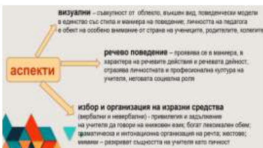
Фиг. 5 Представянето на учителя пред учениците