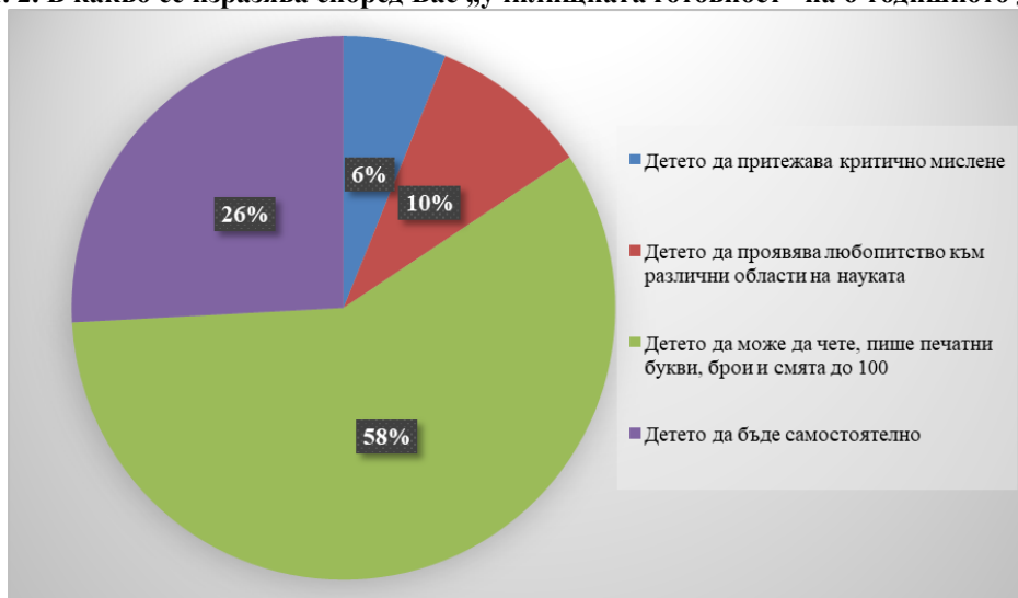
Фиг. 2. В какво се изразява според Вас „училищната готовност“ на 6-годишното дете?

Най-голям интерес за нас представлява интерпретацията на отговорите на отворения въпрос, изобразен графично във фиг. 2. Най-висок е дялът на родителите, които приравняват училищната готовност с уменията на децата да четат, да пишат печатни букви и да смятат до 100 – 86 души (58%) общо. Това, според нас, показва крайно неразбиране на понятието. Притежаването на критично мислене, според 9 (6%) от анкетираните, е еквивалентно на готовността на детето от трета възрастова група за училище. 14 (10%) от всички родители определят проявата на любопитство от детето към различни научни области като училищна готовност. Сравнително немалък дял от анкетираните – 38 души (26%) – смятат, че готовото за училище дете трябва да може да се самообслужва, да се храни само, да притежава самоконтрол. Никой от анкетираните лица не определя училищната готовност като интегративно понятие, включващо много и различни развити знания, умения и отношения, представляващи придобити академични знания и