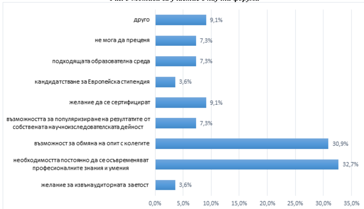
Фиг. 3 Мотиви за участие в научни форуми