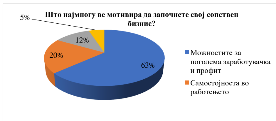
Графикон 3. Мотивациски фактори за започнување сопствен бизнис на таргет групата на млади луѓе од 18-29 години

Од мотивациските фактори, дистрибуцијата на одговорите дадени од страна на таргет групата се прикажани во графиконот 3.