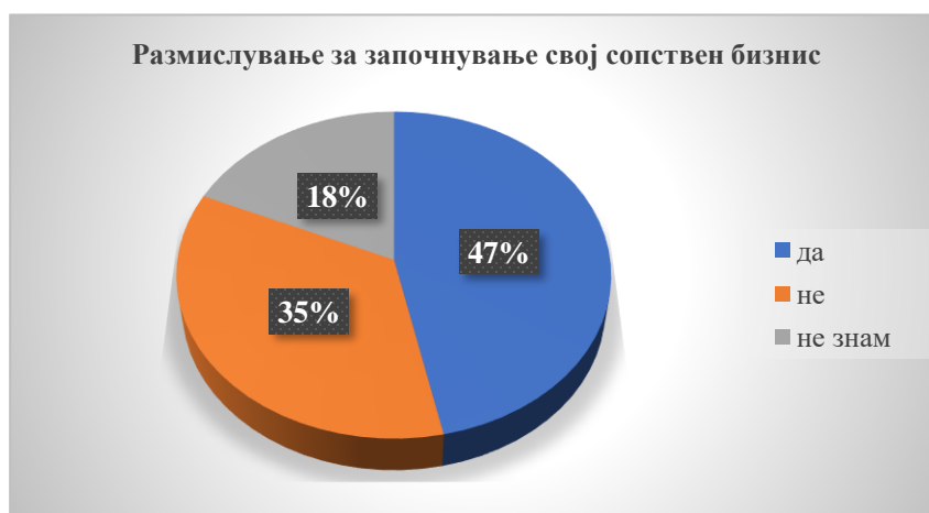
Графикон 2. Размислување за започнување сопствен бизнис на таргет групата на млади луѓе од 18-29 години

Од графиконот 2 може да се види дека 47% од испитаниците размислувале за основање на сопствен бизнис. Тоа значи дека имаат идеи но, не знаат како да го направат тоа. Исто така не знаат каде може да се стекнат со знаења и вештини за отворање на сопствен бизнис. Но, во секој случај сметаат дека Интернетот е значаен ресурс за нив и може да најдат се што им треба. Не е за занемарување ниту процентот од 35% од испитаниците дека не размислуваат за основање на сопствен бизнис, додека 18% не се изјасниле по однос на прашањето. Во секој случај, сепак има поле на делување кај младите луѓе да се поттикне размислувањето за основање на сопствен бизнис. Од аспект на обуките сите испитаници се изјаснија дека досега не посетувале никакви обуки но, би сакале да посетуваат обуки од различни области каде што ќе може да стекнат нови знаења. Сакаат да посетуваат обуки за ИТ технологии, менаџмент, креативност, финансии, претприемништво но, и обуки во странство. Исто така, треба да се спомене дека испитаниците сметаат дека обуки може да најдат во невладините организации. Од аспект на информации за обуки сакаат да добиваат информации на маил или на телефон.