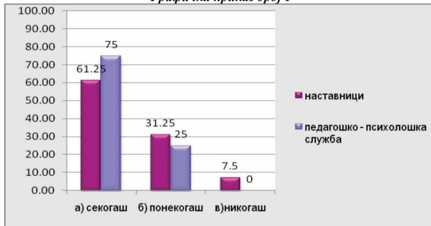
Графички приказ број 1

Констатираната состојба во училиштата покажува дека не се преземаат активности за меѓусебна поделба на наставните содржини меѓу одделенските наставници од една генерација. Ваквото тврдење е поткрепено со тоа што речиси 2/3 од наставниците и соработниците укажуваат дека не се практикува ваков тип на настава.