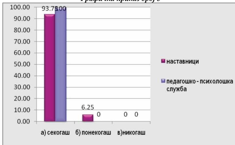
Графички приказ број 3

Иако не се практикува размена на содржини, меѓу одделенските наставници доминира мислењето (75% од наставниците и сите испитани стручни соработници), дека размената на наставни предмети меѓу одделенските наставници доведува до зголемена љубопитност кај учениците за наредниот образовен период.