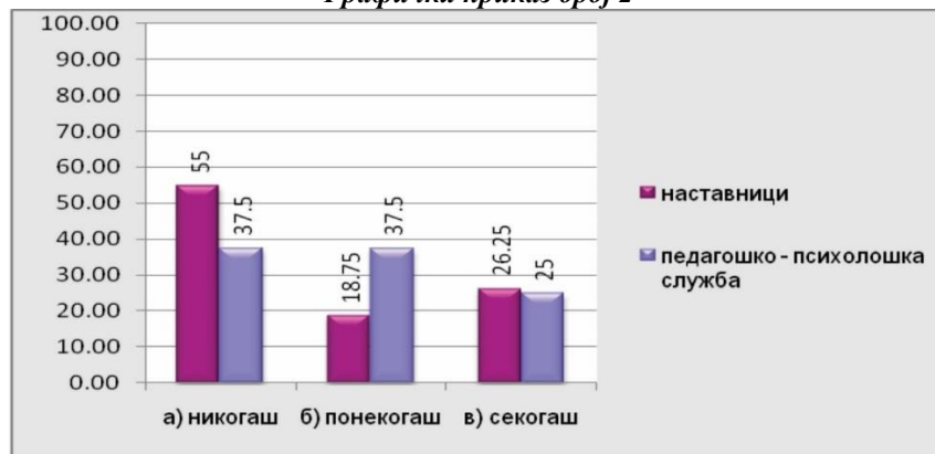
Графички приказ број 2

Иако не се практикува размена на содржини, меѓу одделенските наставници доминира мислењето (75% од наставниците и сите испитани стручни соработници), дека размената на наставни предмети меѓу одделенските наставници доведува до зголемена љубопитност кај учениците за наредниот образовен период.