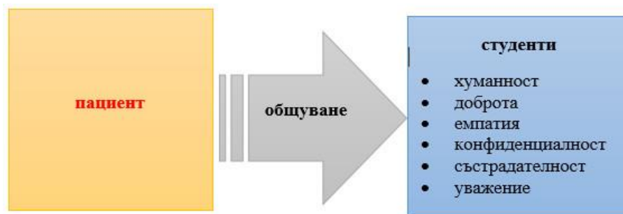
Фигура 2. Формирани качества в обучаваните от общуването с пациента

Опознаването на пациента дава възможност на студентите да разберат по-добре мислите и чувствата му, което е предпоставка за предоставяне на ефективна помощ и грижа, отговаряща на специфичните нужди.