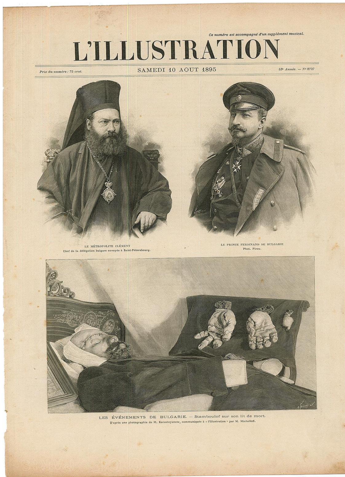
Сн. 2 Първа страница на седмичника L'ILLUSTRATION, който е отпечатан в Париж на 10 август 1885 година. Литографията е изработена от посмъртната снимка на Стамболов.