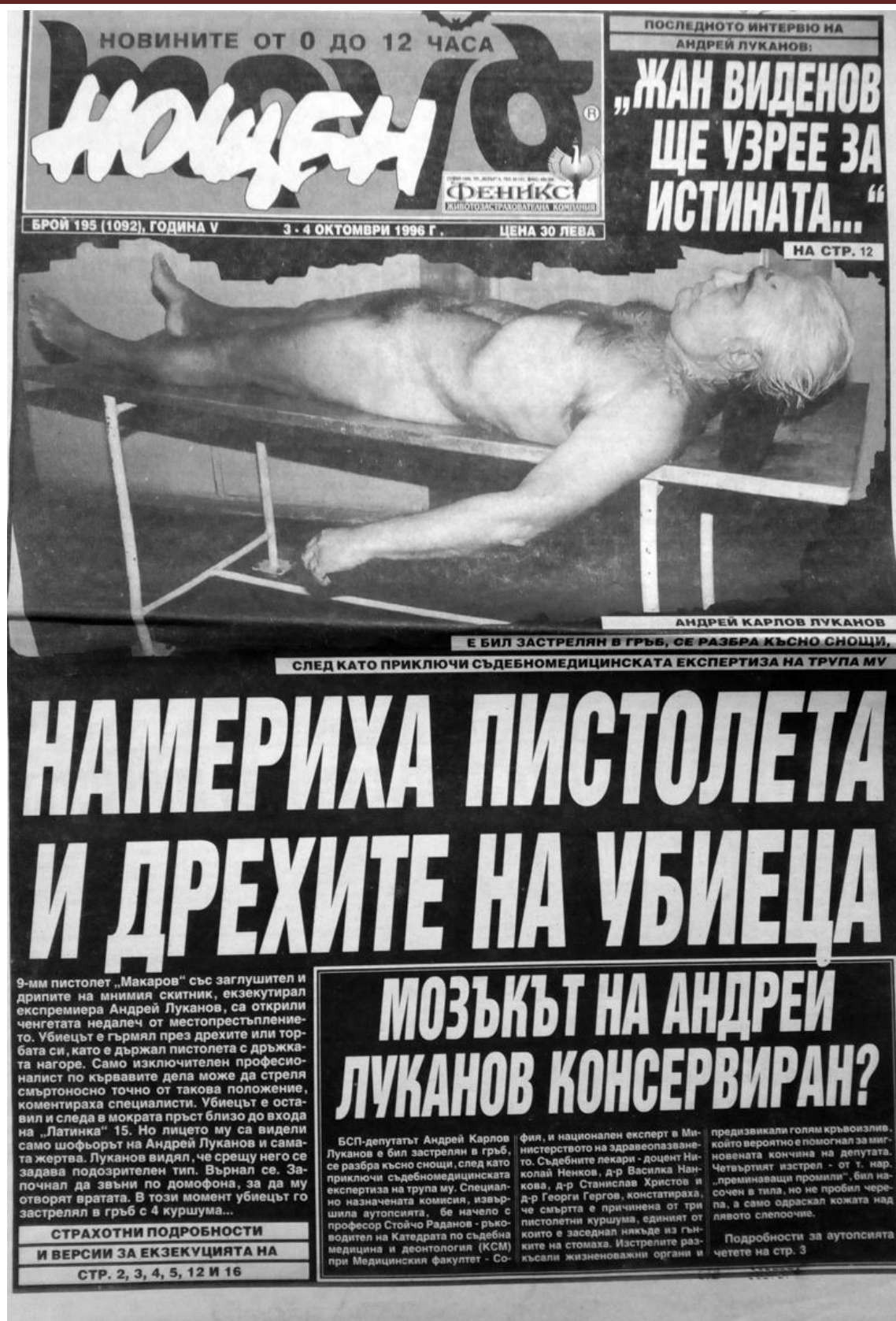
Сн.5 „Нощен Труд“, първа страница, брой 195, 3-4 октомври 1996 г., Луканов в моргата