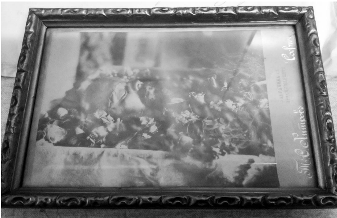
Сн.4 Посмъртната снимка на Стамболов, заснета от Тома Хитров. Той не включва в кадъра отрязаните му ръце. Национален исторически музей