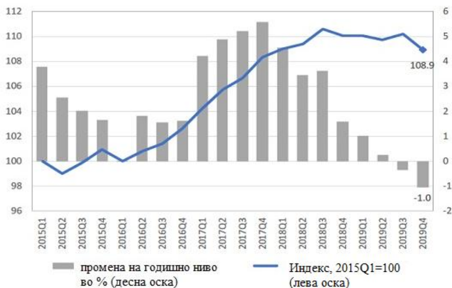
Графикон 1. Увоз и извоз на стоки на глобално ниво, 2015Q1-2019Q4

Глобалната трговија со стоки стагнираше во 2019 година, како резултат на постојните трговски тензии и заврши со негативна стапка на раст. Ваквата состојба квартално, мерена според просекот на увоз и извоз е прикажана на графикон 1: